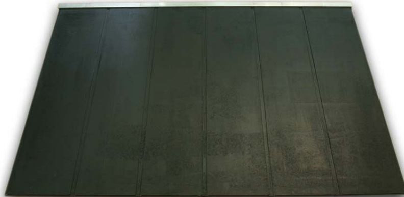
Stahlcord-TL-Platte Typ D 300 x 400 / 500 / 600 / 700