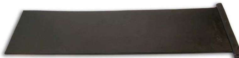
Stahlcord-Lamelle mit Wulst Typ C 200 x 500 / 600 / 700 / 1000