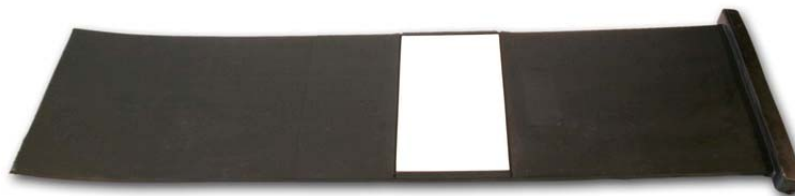
Stahlcord-Lamelle mit Wulst Typ B mit weißen Anfahrstreifen 140 x 500 / 600 / 700