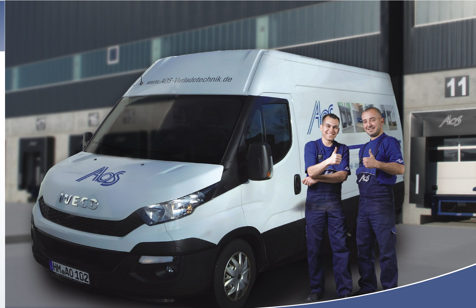
Arnold Oberüber Service-Verladetechnik e.K.

Kompetenz für Andocksysteme und Verladetechnik mit bundesweitem Service-Partner-Netzwerk.